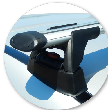
Со снятой крышкой стойки