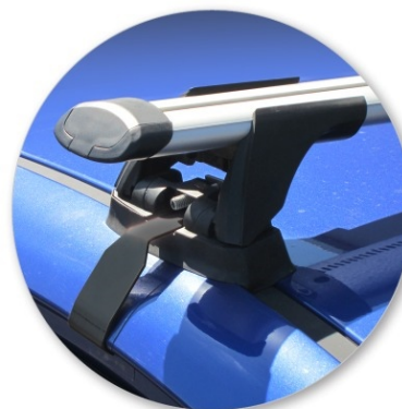
Со снятой крышкой стойки